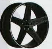
▲マットブラック×マシニードフェイス

1 リップがテーパード状に広がるRL(リバースリップ)。スポークはコンケーブフォルムだ 2 スポークに入るロゴはレリーフ 3 スポークエンドはリム外側に接してホイールを大きく見せる 4 リムに小さくジオバンナロゴ 5 スポーク天面を切削してあるが、中央はさらに凹んでいる。