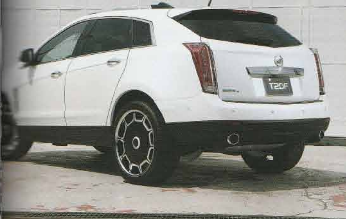
流行型の新車であるこのSRXの車格にも、セレブ度満点のジオバンナはベストマッチしている。