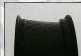
ボルトフィーノの断面。向かって右が内側、左が外側(デザイン面)。リム断面は円柱ではなく、むしろ円錐だ。