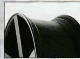
メッカRLのリム。断面形状はボルトフィーノと同じだ。